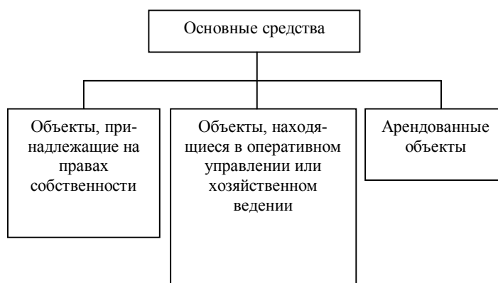
Рисунок 1 – Классификация основных средств по принадлежности