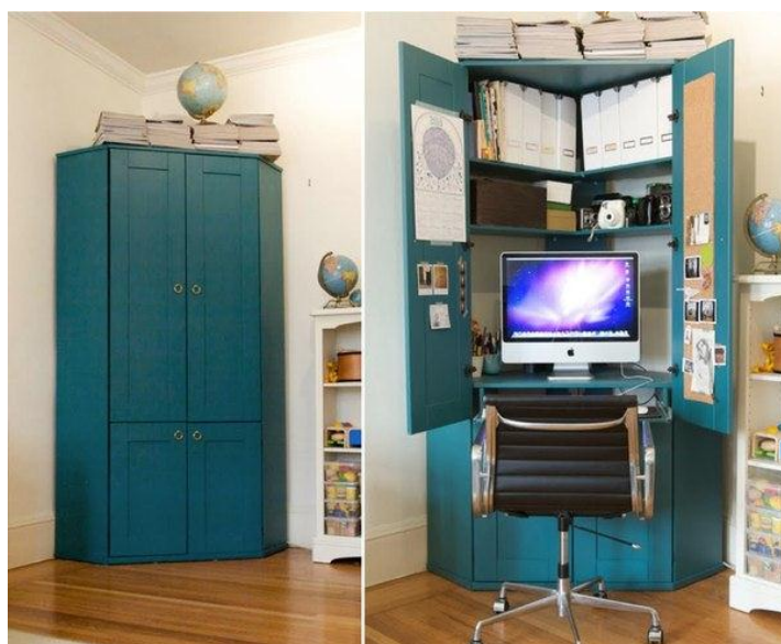
Рис. 4. Домашний офис в шкафу в закрытом и открытом виде