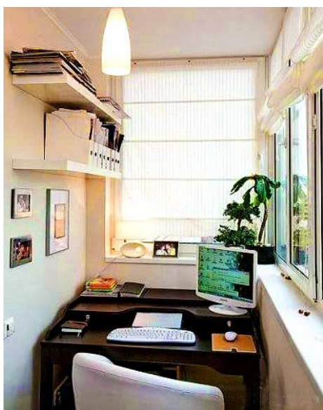
Рис. 3. Домашний офис на балконе

Рабочий личный кабинет, будь то творческая мастерская или вариант офиса на дому, должен быть гораздо более функциональным, нежели представительский вариант. Кстати, в этом случае обустройство домашнего офиса обойдется в меньшую сумму, чем помещения, призванного производить впечатление. Современный рабочий кабинет офисного типа невозможно представить без компьютера, функциональной блочной мебели, действительно комфортного рабочего кресла, стеллажей для хранения информации. Если в нем предполагается проводить прием посетителей, то расстановка мебели должна быть зонированной. Хотя не многие дома могут иметь отдельную комнату, чтобы превратить ее в домашний офис. Поэтому в настоящее время пользуются популярностью рабочие места, расположенные в нишах, под лестницей, в шкафах-купе, в виде отдельных рабочих мест в одной из комнат квартиры или в торцах балконов (рис. 3, 4). Едва ли не самым важным аксессуаром личного рабочего кабинета является кресло, в котором человек проводит несколько часов в день. Оно должно быть эргономичным и иметь конструктивную возможность подстраиваться под комплекцию и фигуру конкретного человека [2].