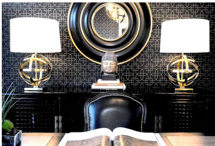
Рис. 1. Имиджевый интерьер

Можно сказать, что обустройство домашнего офиса получило две ветви развития. Первая ветвь - более имиджевая, существующая не столько для практических целей, сколько направленная на поддержание имиджа и статуса владельца дома. В таких помещениях все должно подчеркивать респектабельность и социальный вес его владельца: от дорогой люстры до мебельной фурнитуры и произведений искусства (рис. 1) [1].