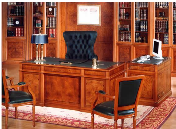
Рис. 2. Классический офис

Так уж повелось, что чем выше уровень человека в обществе, тем больше офисы дома выдержаны в классическом или викторианском стиле. Современные производители классической мебели для офисов, сохраняя стиль минувших эпох, применяют новейшие технологии обработки дерева. Двухтумбовый дубовый или ореховый стол с мраморной или кожаной столешницей – вещь дорогая, комфортная и престижная. За таким столом удобно работать (рис. 2).