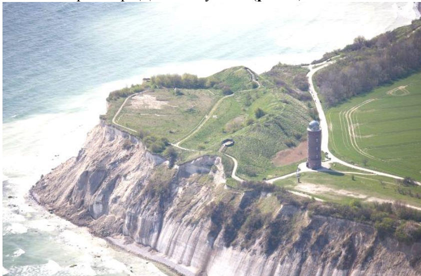
Рис. 2. На этом мысу острова Руян-Рюген располагался славянский город-храм Аркона

Шпрее, в сербско-лужицком регионе Германии (федеральная земля Бранденбург), вблизи села Радуш расположена крепость западных славян Славенбург. Это древний славянский круглый замо́к IX века н.э., одно из 40 изначально существовавших в Нижней Лужице круглых оборонительных сооружений, сооружавшихся славянами – предками лужичан и служивших убежищами окрестному населению. Раньше это был славянский город-вара Дольна Лужица (рис. 4).