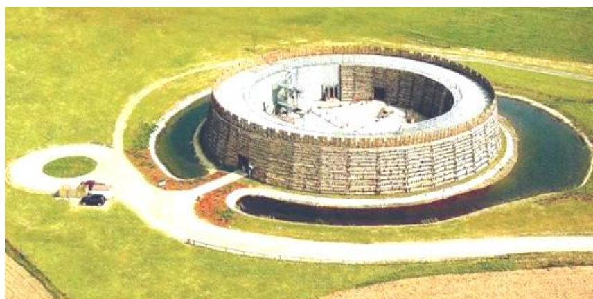
Рис. 4. Реконструированный древнерусский город-вара Дольна Лужица - музей древнеславянской архитектуры «Slawenburg-Raddusch», Германия.