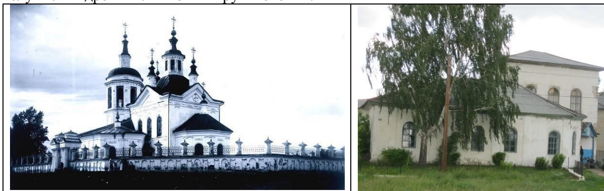
Владими́ро-Бого́родицкая церковь села Крутихи в 1924 году (слева,) и то, что от неё осталось к настоящему времени (справа,).