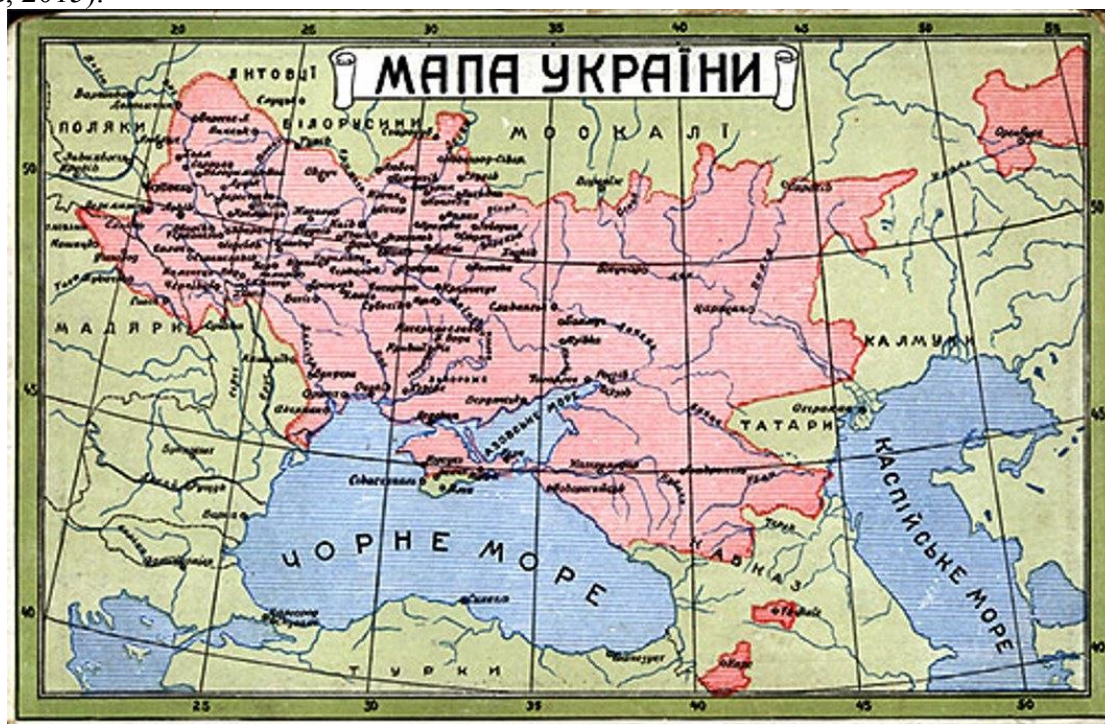
Территориальные претензии «мазепинцев» (Иванов, 2015).

А вот текст из Директивы Совета Национальной Безопасности США 20/1 «О целях США в отношении России» от 18 августа 1948 года с грифом «Совершенно секретно»: «Украина не является четко определенным этническим или географическим понятием. В целом население Украины изначально образовалось в основном из беженцев от русского и польского деспотизма и трудноразлично в тени русской или польской национальности. Нет четкой разделительной линии между Россией и Украиной, и установить ее затруднительно. Города на украинской территории были в основном рус-