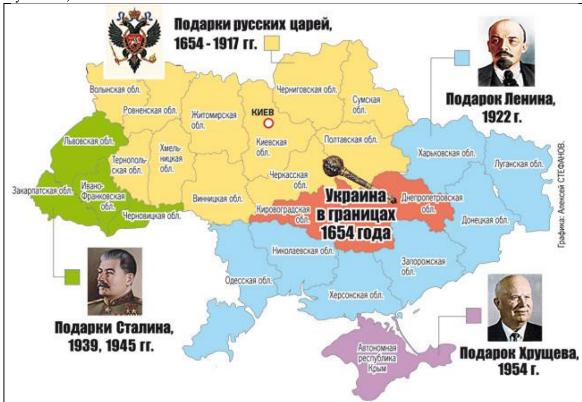
Формирование территории Украины (Матишов, 2014; Крымова, 2014).

На политической карте Восточной Европы в 1340—1389 годах ни Украины, ни Белоруссии, ни Латвии, ни Эстонии не видно! ( https://topwar.ru/6057-o-poyavlenii-ukrainskogo-yazyka.html ).