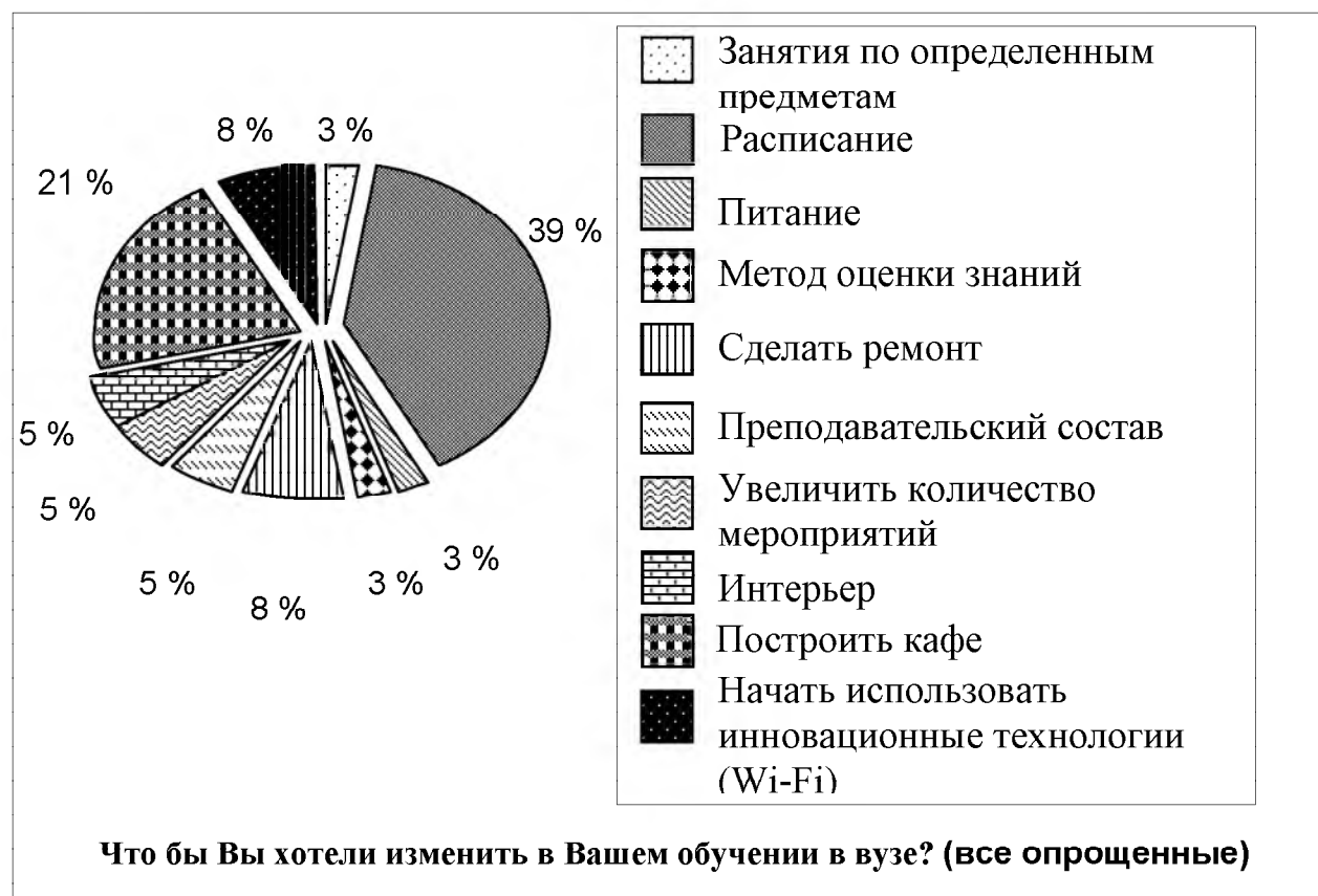
Рис. 3. Пожелания изменений, необходимых вузу для повышения эффективности образовательного процесса

«История» и «Основы менеджмента», у студентов 2, 3, и 4 курсов – это «Менеджмент». У пятикурсников этих предметов становится намного больше.