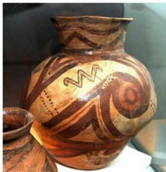
Сосуды из трипольской культуры с элементом W. По данным (см. пред. рисунок)

Таким образом, прослеживаются истоки арийских миграций в Европе – культура Лепенского Вира (9400-8200 лет назад) – Трипольская культура (7500-4750 лет назад) – переход ариев на Русскую равнину, 4800-4600 лет назад, и далее, до Ирана, Индии, Зауралья, Китая. То, что в культуре Лепенского Вира могли проживать носители R1a, предки будущих восточных славян, следует из их погребального обряда – на боку, в скорченном положении. Это все надлежит еще изучать и дополнительно обосновывать, но для гипотезы вполне достаточно.