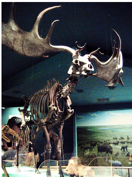
Скелет Megaloceros giganteus

Но вообще-то рога оленей – не слишком грозная придумка. Они очень лёгкие. При размахе до 120 см их вес не превышает 11-12 кг. Это подлинный шедевр природы. Эстетика тут своеобразная. Между левой и правой частями рогов нет зеркального подобия. Отсутствует симметрия! Налицо отступление от классического канона, столь авторитетного для всей биосферы.