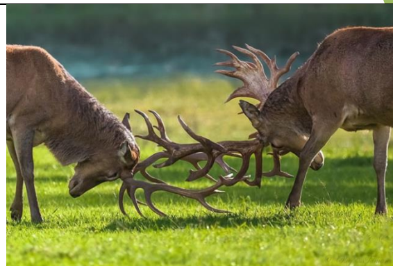
Гон в разгаре. Олени заплетались рогами так...

Отсутствие полового диморфизма в данном единичном случае – большая проблема для биологов. Природа здесь решила гендерную проблему методом уравнивания полов?