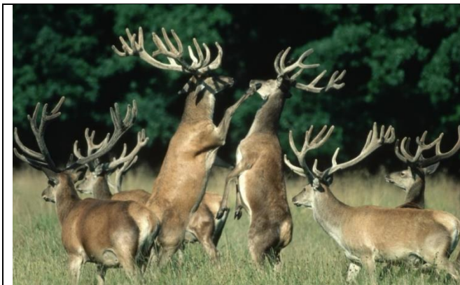
Да здравствует половой отбор! Побеждает красота.