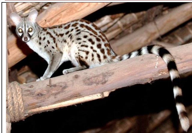
Генета. Тот же владеет полосатым хвостом – ещё более длинным и роскошным