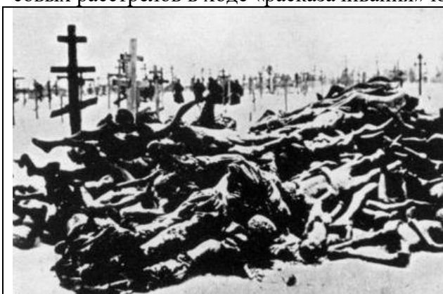
Голод. Хоронить людей было некому даже на кладбищах (Хиценко, 2012).

Книга А. Чудакова привлекла мое внимание местом рождения её автора – это город Щучинск (в романе – Чебачинск) в Северном Казахстане, где мне довелось прожить более 20 лет, работая в Казахском НИИ лесного хозяйства. На заставке книги я прочёл, что она издана в серии «Библиотека Всемирной Литературы», что автор – выдающийся российский филолог, написавший роман, «с высочайшей концентрацией исторической правды воссоздав образ истинной России в её тяжелейшие годы». По прочтении этих слов сразу представились сцены доходящего до каннибализма голода после «ликвидации кулачества как класса», а также сцены массовых расстрелов в ходе «расказачивания» южных рубежей страны.