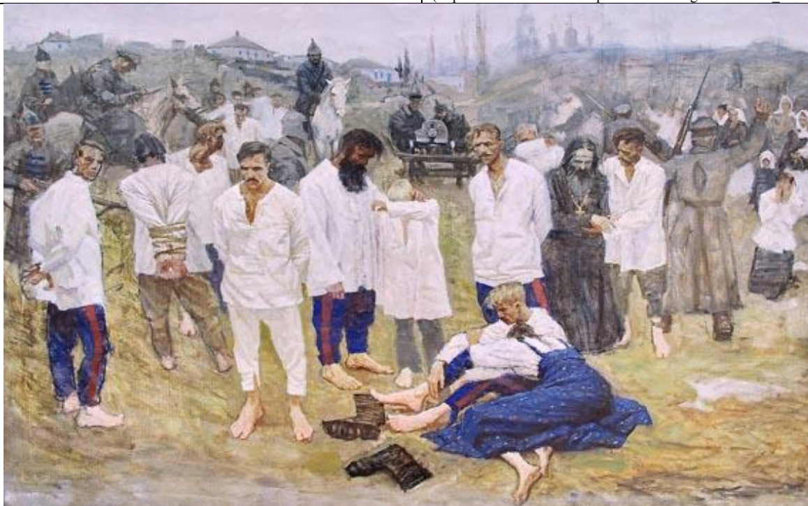
Расказначивание. Худ. Дм. Шмарин.

Совершенно секретно: Одно из свидетельств людоедства при «голодоморе» (Спецсводка Главного управления Рабоче-крестьянской милиции при ОГПУ о людоедстве в Нижне-Волжском крае. 14 марта 1933 г. ЦА ФСБ РФ. Ф. 2. Оп. 11. Д. 551. Л. 80. ( http://www.rusarchives.ru/publication/hunger-ussr/1933_19.shtml )