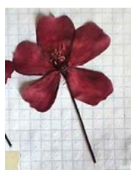
№ 11 (Харитоновский парк) No. 11 (Kharitonovskiy Park)