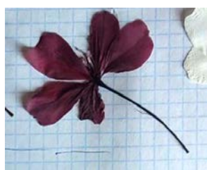
№ 10 (ТЦ «Европа») No. 10 (Shopping center «Yevropa»)