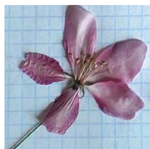
№ 15 (памятник Петру и Февронии) No. 15 (Monument to Peter and Fevronia)