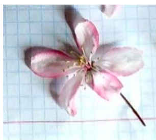
№ 6 (корпус №5 УГЛТУ) No. 6 (Building No. 5 USFEU)