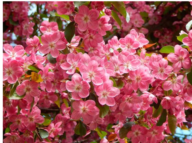
Рис. 3. Перспективные по зимостойкости формы яблони гибридной с пышным цветением и крупными цветками для озеленительных посадок на Урале Fig. 3. Perspective in terms of winter hardiness forms of hybrid apple trees with lush flowering and large flowers for landscaping plantings in the Urals