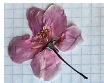
№ 2 (ул. Восточная × ул. Ленина) No. 2 (Vostochnaya St. × Lenin St.)