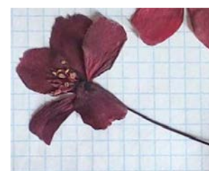
№ 16 (дендропарк, ул. 8 Марта) No. 16 (Dendrological park, 8 Marta St.)