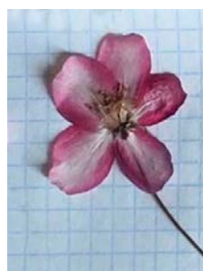
№ 14 (памятник Петру и Февронии) No. 14 (Monument to Peter and Fevronia)