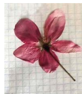
№ 8 (Дворец спорта, ул. Большакова) No. 8 (Sports Palace, Bolshakova St.)