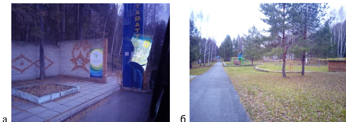
Рис. 2. Малые архитектурные формы, оставшиеся от пионерского лагеря: а – остановочный комплекс с пионерской атрибутикой; б – вид на детскую площадку

От пионерского лагеря на территории сохранились не только планировка и здания, но и большая часть малых архитектурных форм, включая остановочный комплекс (рис. 2, а), детскую площадку (рис. 2, б) и т.д.