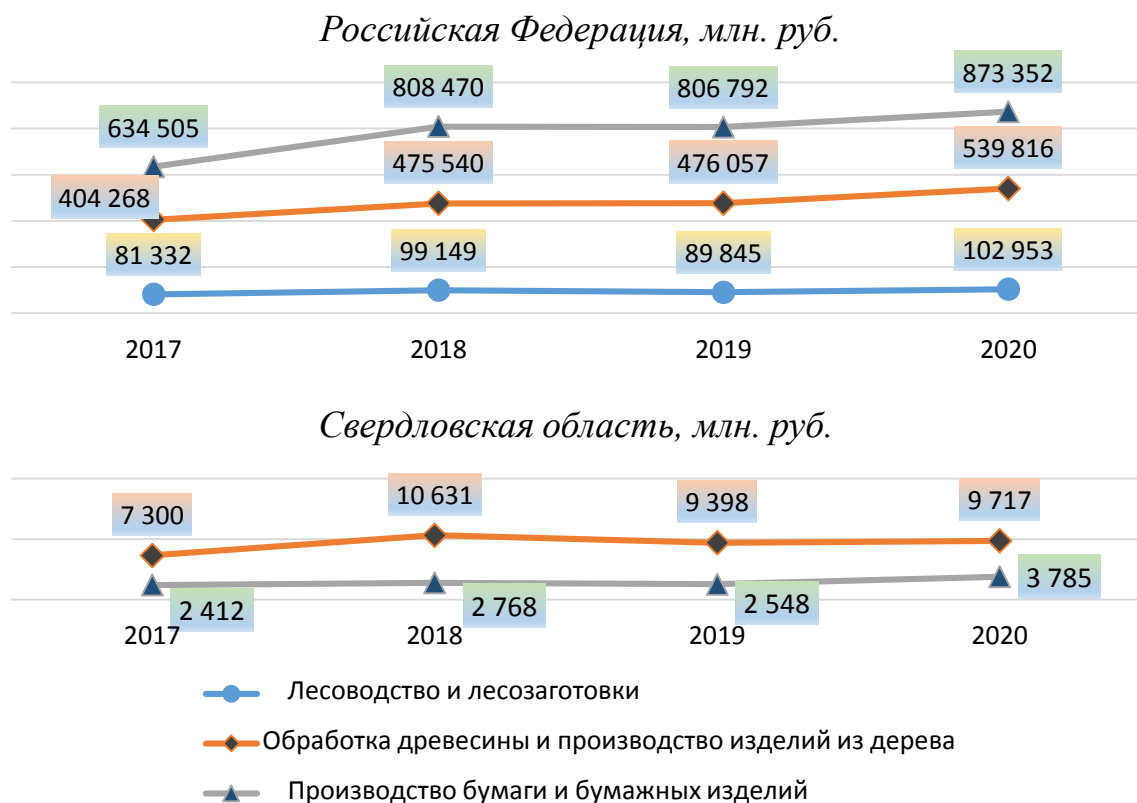
Рис. 2. Динамика выручки по видам экономической деятельности лесного сектора

Потребность рынка в отраслевом продукте отражает показатель выручки от продаж (табл., рис. 2). Лесной сектор Свердловской области и в целом РФ демонстрирует падение объемов реализации в 2019 году. При этом на рынке России деревообрабатывающая отрасль сохранила объемы предыдущего периода, тогда как по остальным видам деятельности наблюдалось снижение: по ЦБП – на 0,2 %, по лесоводческой и лесозаготовительной деятельности – на 9,4 %. В Свердловской области в 2019 году снижение произошло по всем структурным элементам лесного сектора и в совокупности составило 10,8 %.