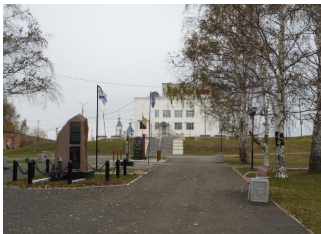
Рис. 3. Памятные стелы

С того времени у данных объектов проходят митинги, торжественные мероприятия, встречи ветеранов труда и войны. Традиционно проходит возложение цветов и почитание минутой молчания погибших в годы Великой Отечественной войны.