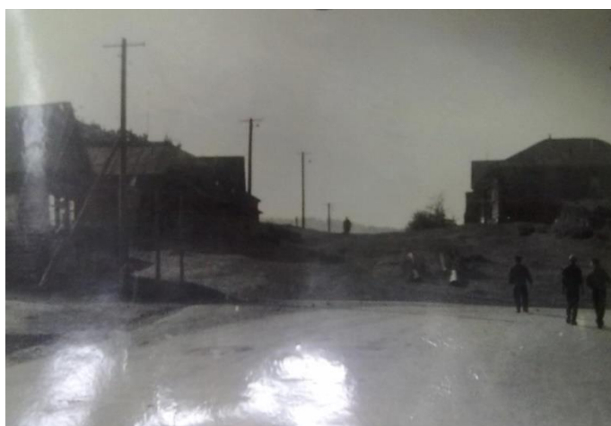
Рис. 2. Сипкина гора

Идея создания парка была одобрена хозяйственным комитетом завода. На ул. Володарского находились жилые дома, поэтому для постройки парка возникла необходимость сноса зданий. Оценка домовладений проводилась для всех домов, многие жители поселка с трудом согласились на данные условия.