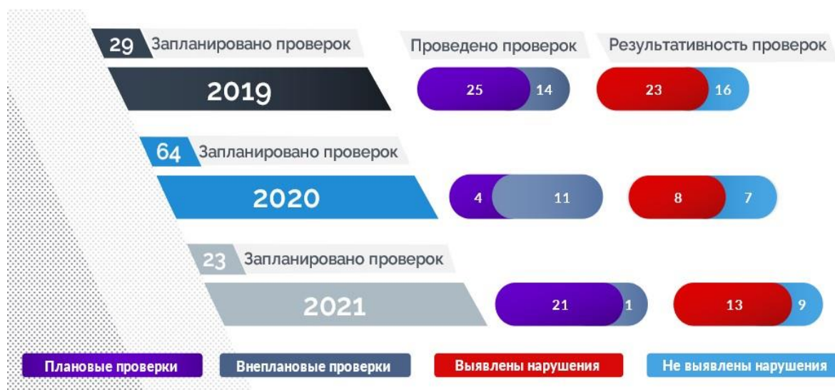
Рис. 1. Статистика проверок и нарушений лесного законодательства на территории Красноярского края за период с 2019 по 2021 гг.

Анализ трехлетних данных показал, что большая часть (от 53 до 59 %) проверок результативна, то есть в процессе работы были зафиксированы правонарушения лесного законодательства. Для пресечения доминирующих лесонарушений стоит рассмотреть их структуру.