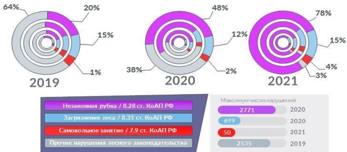
Рис. 2. Структура и количественное соотношение лесонарушений на территории Красноярского края в 2019–2021 гг.