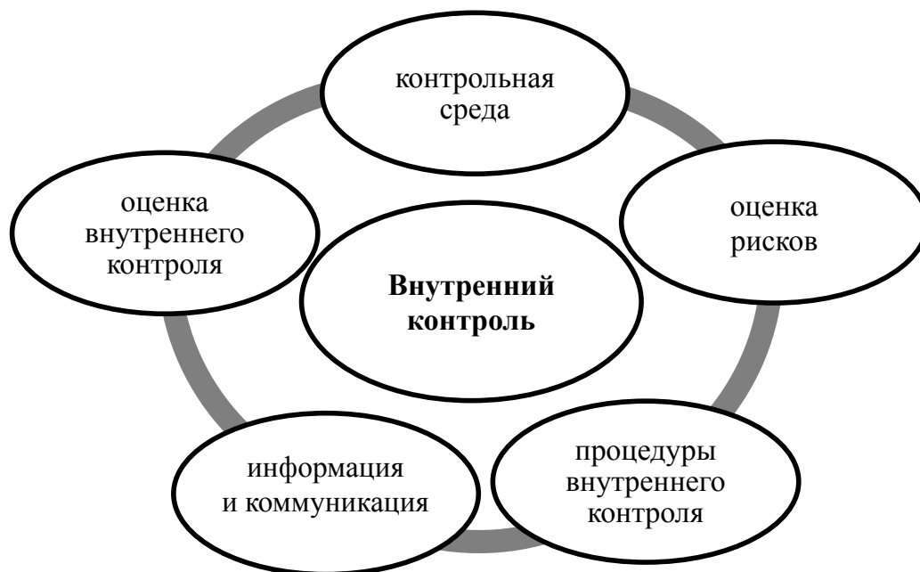
Рис. 2. Элементы системы внутреннего контроля

быть разработана карта рисков в разрезе их видов, сегментов бизнеса, фактов хозяйственной жизни, включая обычные и необычные операции. В отношении каждого риска должен быть разработан методический инструментарий, который будет использован при их идентификации и оценке (рис. 3).