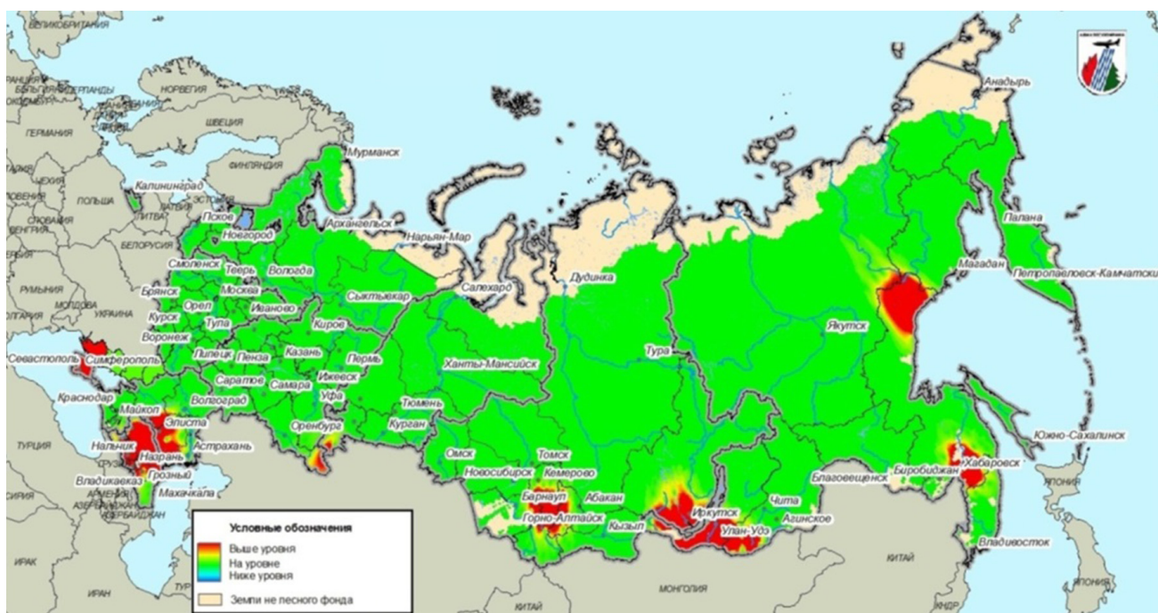
Рис. 2. Вероятностный прогноз возникновения пожаров в лесах России на сентябрь 2023 года Fig. 2. Probabilistic forecast of fires in the forests of Russia for September 2023

Несмотря на то, что лесные пожары появились задолго до того, как человек научился добывать огонь, на сегодняшний день большинство лесных пожаров происходит именно по вине человека, а с приходом весны мы становимся беззащитны от огненной стихии. Если продолжать в том же духе, следующим поколениям останутся от былой могучей русской природы лишь пни, гари и болота.