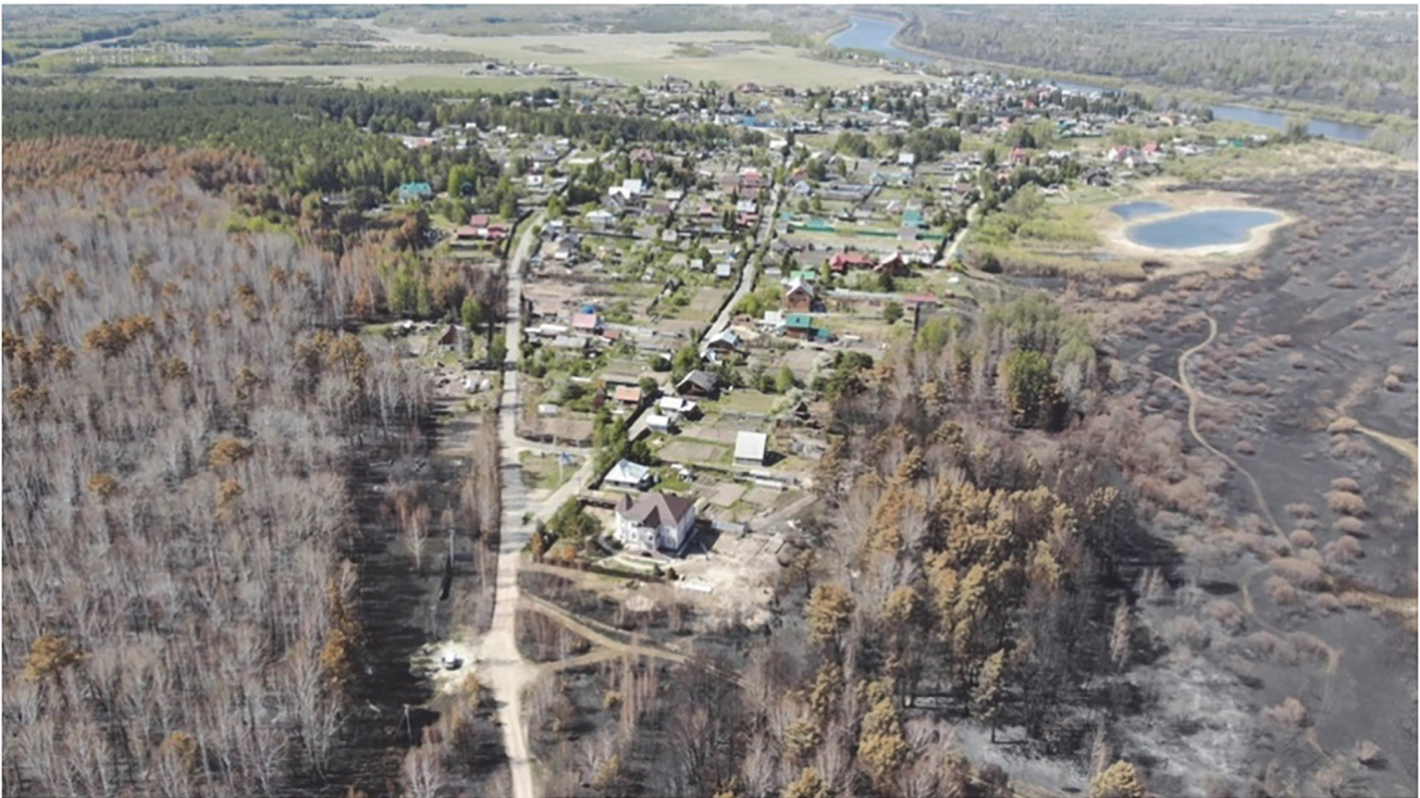
Рис. 3. Фотография деревни Речкина от 19 мая 2023 г. с БПЛА Fig. 3. Photo of the village of Rechkin from May 19, 2023 from a UAV

Особое внимание уделяется территориям вокруг водоемов, поскольку указанные территории наиболее интенсивно посещаются людьми, что увеличивает вероятность возникновения пожаров. Вблизи водоемов производится благоустройство территории, а также создание системы противопожарных барьеров, исключающих перемещение потенциального пожара на прилегающие территории. Так, в частности, в целях недопущения ухудшения эстетической привлекательности минерализованные полосы вокруг зон отдыха заменяются посадками многолетнего люпина. Красиво цветущие растения люпина имеют высокую влажность в течение всего периода вегетации, что исключает распространение огня. Благоустроенные места отдыха вблизи водоемов позволяют сконцентрировать отдыхающих и тем самым облегчить охрану лесов.