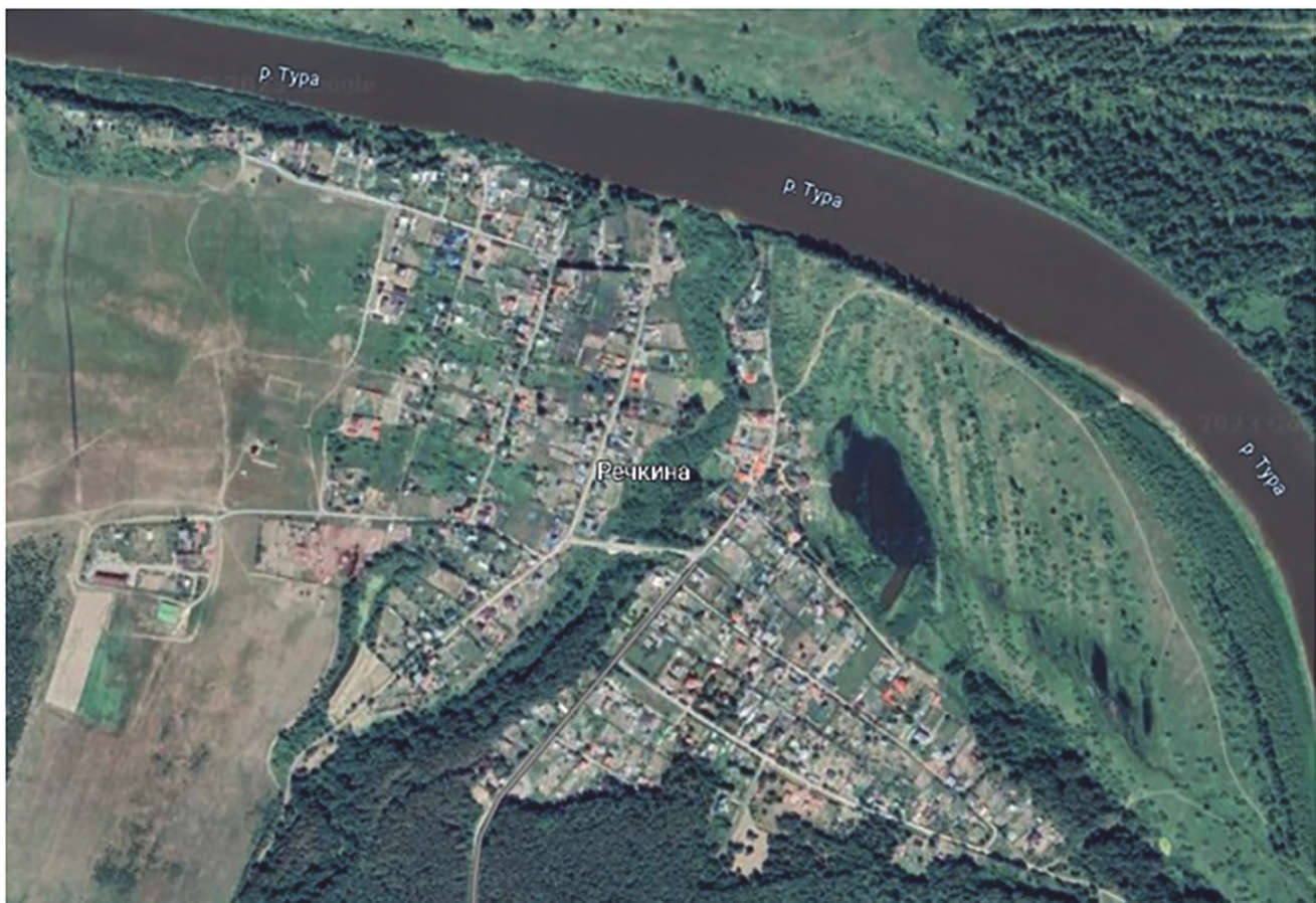
Рис. 2. Космоснимок деревни Речкина Fig. 2. Satellite image of Rechkin village

Разработка проекта противопожарного устройства осуществляется на базе картографических материалов, данных лесоустройства и натурного обследования сельскохозяйственных земель в радиусе 5 км от населенного пункта. В процессе анализа собранных материалов выполняется определение классов пожарной опасности обследованных территорий и разрабатываются мероприятия по минимизации пожарной опасности.