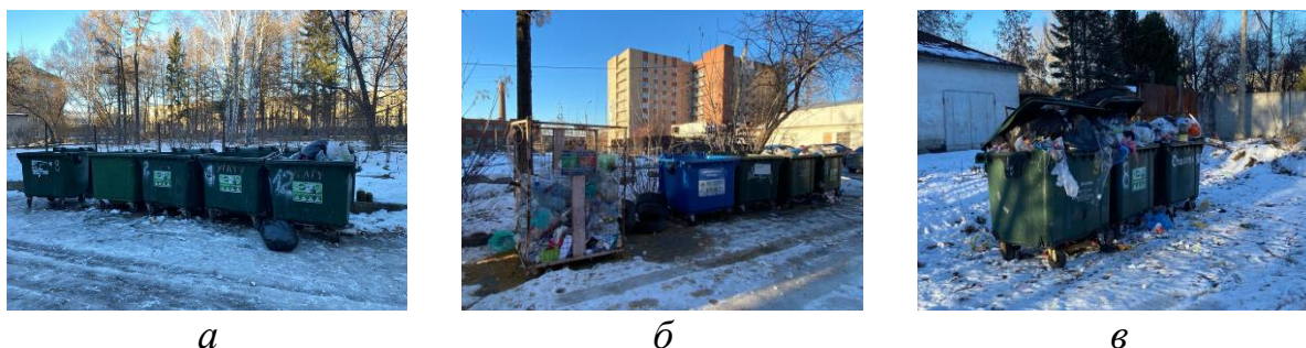
Рис. 2. Фотофиксация существующего состояния мусороконтейнерных площадок на территории студенческого городка УГЛТУ: а – в районе общежития № 3; б – в районе общежития № 6А; в – в районе общежития № 7

Описание существующего положения мусороконтейнерных площадок, расположенных на территории студгородка УГЛТУ, было выполнено по результатам маршрутных (натурных) обследований (рис. 2).