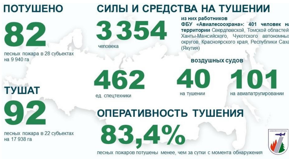
Рис. 2. Ликвидация лесных пожаров в России за 11 июня 2023 г. (ФБУ «Авиалесоохрана»..., 2023) Fig. 2. Elimination of forest fires in Russia for June 11, 2023

Помощь в контроле обстановки в Свердловской, Томской областях, Чукотском, Ханты-Мансийском АО, Якутии, Красноярском крае оказывали 693 работника Федеральной Авиалесоохраны, Авиалесоохраны Архангельской, Новосибирской, Мурманской областей, Пермского, Красноярского, Приморского краев, республик Карелия, Коми, Тыва, Бурятии. Особый противопожарный режим действовал в 55 субъектах России, режим ЧС – в 6 субъектах России. Оперативность тушения с начала года составляла 83,4 % лесных пожаров, ликвидированных менее чем за сутки с момента обнаружения.