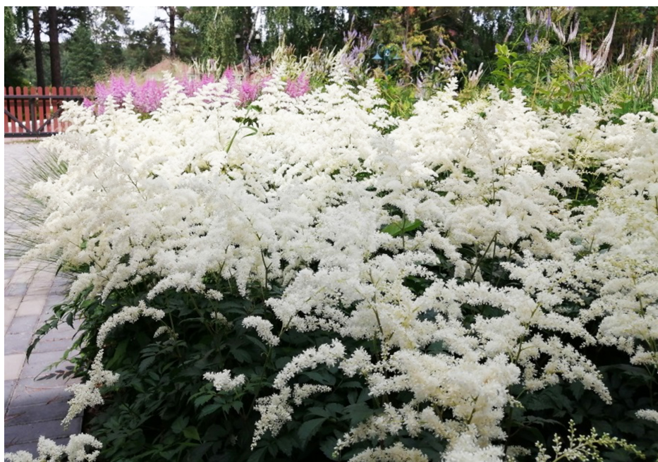
Рис. 5. Цветение Astilbe × arendsii 'Brautschleier' (Arends)