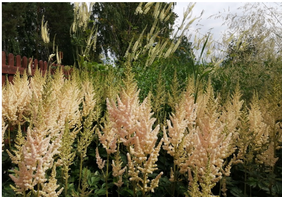
Рис. 4. Цветение Actaea racemosa L. и Astilbe chinensis 'Milk and Honey' (Maxim.) Franch. & Sav

чало исследований пришлось на пик цветения Veronicastrum virginicum (L.) Farw., который цвел еще месяц, и пик цветения Polygonum polymorpha L., соцветия которого сохранялись до середины сентября.