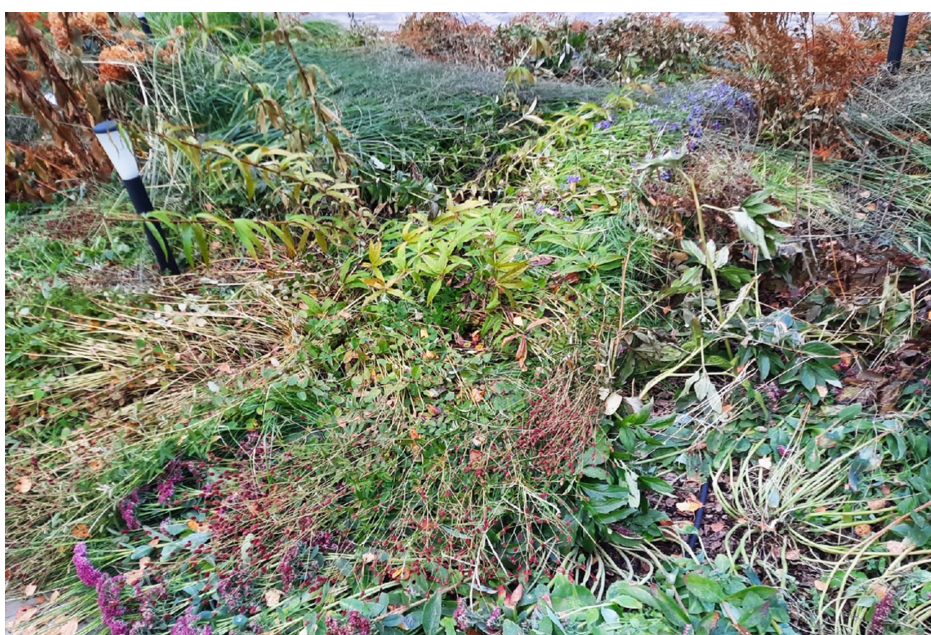
Рис. 3. Состояние цветников в начале октября Fig. 3. The flowerbed condition in early October