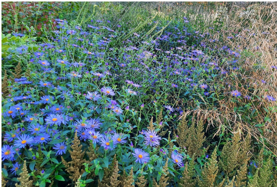
Рис. 2. Цветение Aster × fricartii 'Monch' Fricart Fig. 2. The Aster × fricartii 'Monch' Fricart flowering

spectabile 'Brilliant' H. Ohba – 2 мес. (с начала августа по начало октября). Следует отметить, что если бы не выпавший снег в конце сентября, то некоторые растения могли продолжить свое цветение. 3 октября, после схода снега, многолетники были срезаны с имеющимися соцветиями из-за потери декоративного вида и вертикального положения (рис. 3).