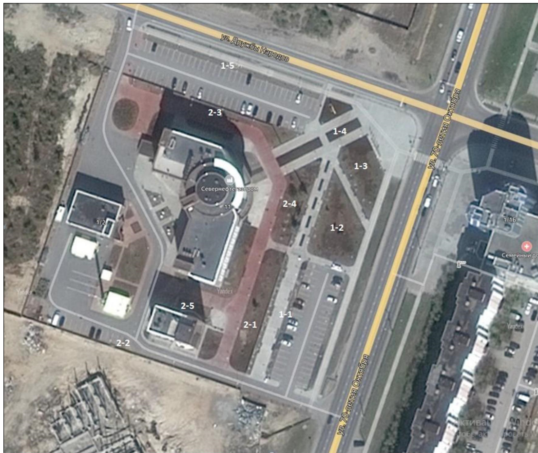
Рис. 2. Расположение мест отбора точечных проб почвогрунтов рядом с офисом ОАО «Севернефтегазпром» в г. Новом Уренгое Fig. 2. Location of soil sampling sites near the office of JSC Severneftegazprom in Novy Urengoy

Также точечные пробы почвогрунта отбирались на газонах, расположенных рядом со зданием АО «Севернефтегазпром» по адресу ул. Губкина, 26. Всего было отобрано две точечные пробы почвогрунтов. Расположение мест отбора представлено на рис. 5 (точечные пробы 4-1–4-2).