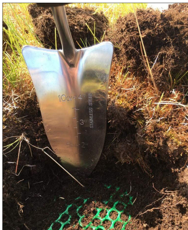
Рис. 3. Слой почвогрунта, расположенного на георешетке, имеет среднюю мощность 10 см Fig. 3. The soil layer located on the geogrid has an average thickness of 10 cm

Определение гумуса проводили по методу Тюрина с использованием в качестве индикатора фенилантраниловой кислоты (Практикум..., 1989; Аринушкина, 1970).