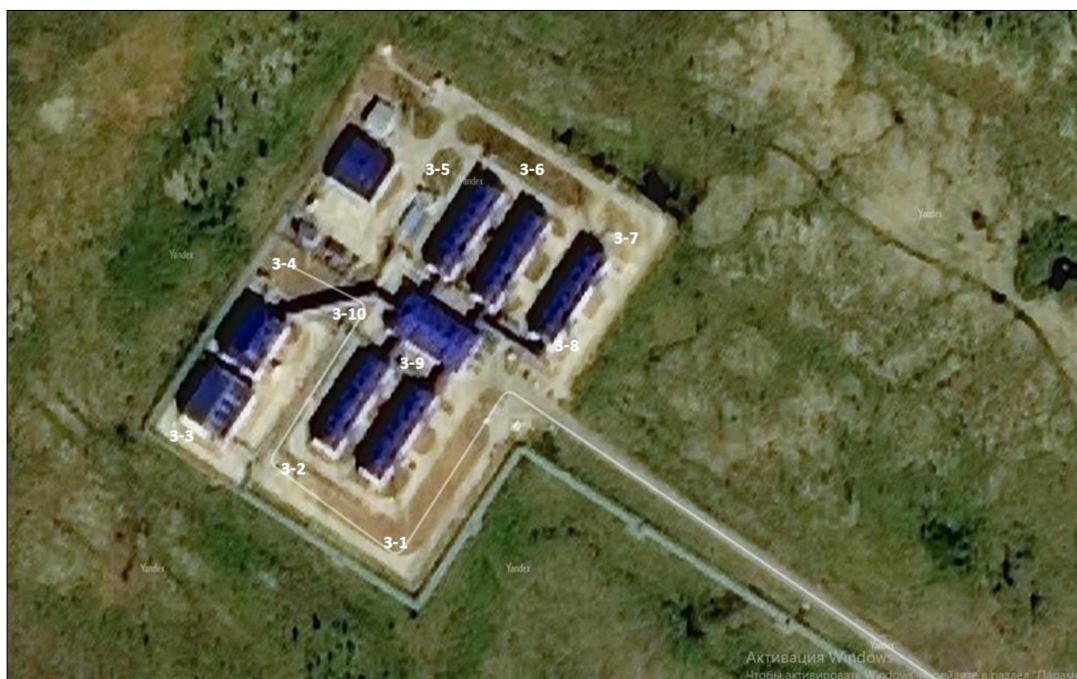
Рис. 4. Расположение мест отбора точечных проб почвогрунтов на территории жилой зоны Южно-Русского нефтегазового месторождения Fig. 4. Location of the sites for sampling of spot soil samples in the residential area of the Yuzhno-Russian oil and gas field