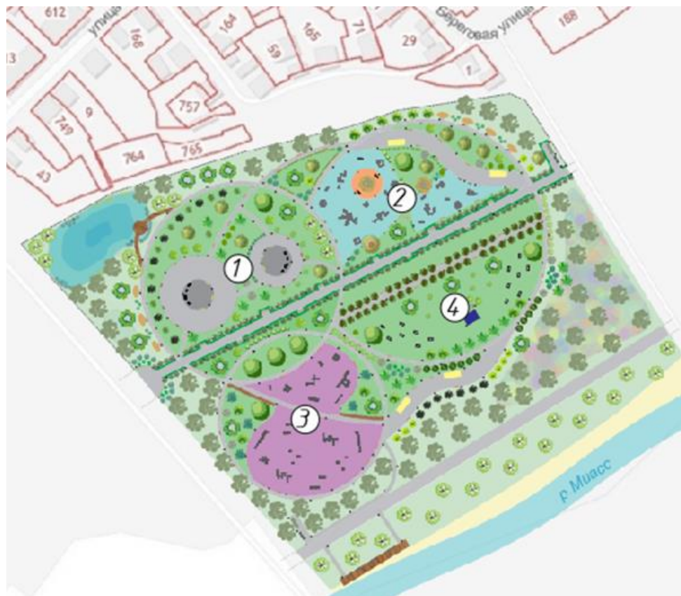
Рис. 2. Фрагмент генерального плана

В административно-хозяйственных зонах, расположенных в разных концах парка, предполагаются мусорные контейнеры и уличные туалетные кабины. Фрагмент генерального плана представлен на рис. 2.