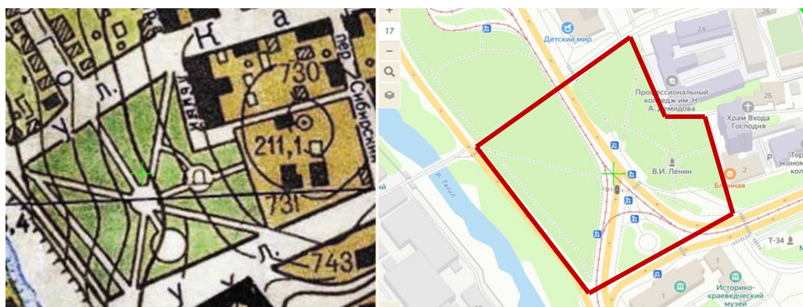
Рис. 4. Сквер рабочей молодежи на карте 1962 г. и 2025 г. — Граница исследуемого объекта