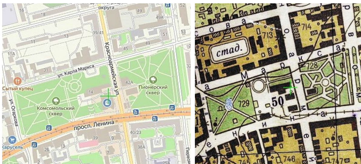
Рис. 3. Комсомольский и Пионерский сквер на карте 1962 г. и 2025 г.