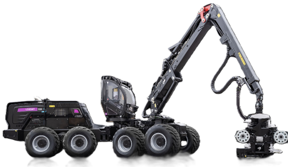
Рис. 1. Logset 12H GTE

Гидравлические системы гибридации базируются на применении гидроаккумулятора – устройства, аккумулирующего избыточную гидравлическую энергию посредством ее конверсии в потенциальную энергию сжатого газа.