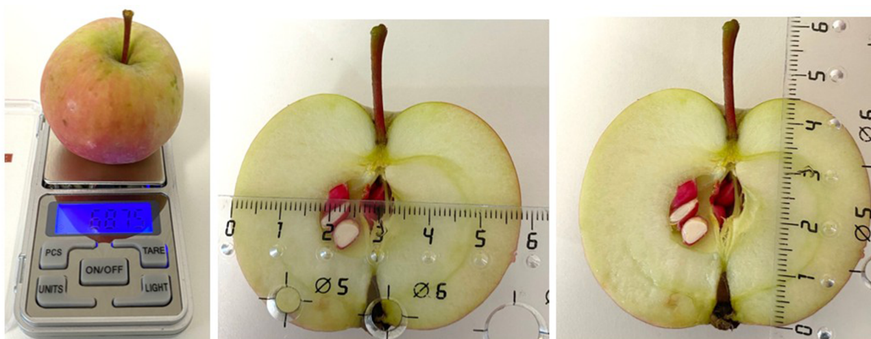
Рис. 1. Определение массы, диаметра и высоты плодов Fig. 1. Determination of weight, diameter and height of fruits

Листья отбирали из средней части кроны по 20 шт. У каждого листа измеряли длину вдоль центральной жилки и ширину в наиболее широком месте с помощью линейки. Площадь листовой поверхности определяли с использованием программы AutoCAD. Контуры листьев наносили на лист с сеткой 0,5 × 0,5 см, затем сканировали ее и, используя программу, определяли площадь листьев (рис. 2).