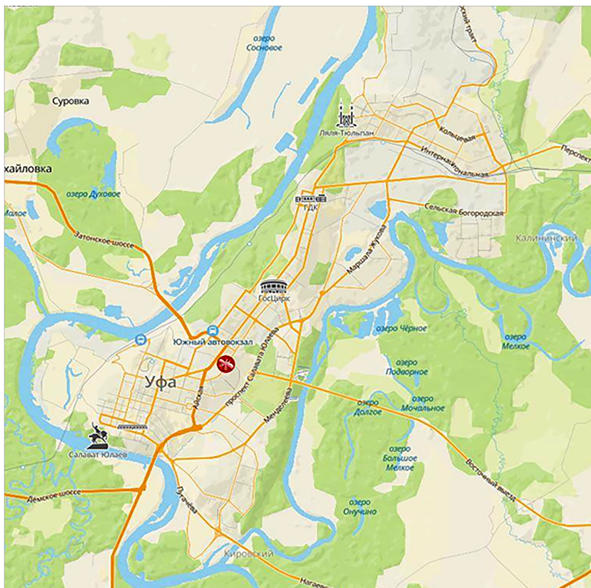
Рис. 1. Планировочная структура г. Уфы Fig. 1. The planning structure of Ufa

отказаться от параллельной структуры, чтобы избавиться от дисбаланса территории, а также уделить внимание развитию отдаленных районов города и созданию парковых и природоохранных зон (Атанян и др., 2018).