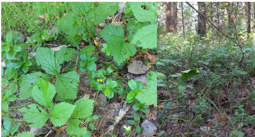
Брусника на горельнике 5-летней давности, С. яг., ПП 4С/22 Lingonberry on a fire-damaged forest area 5 years ago, pine forest type, SP 4C/22