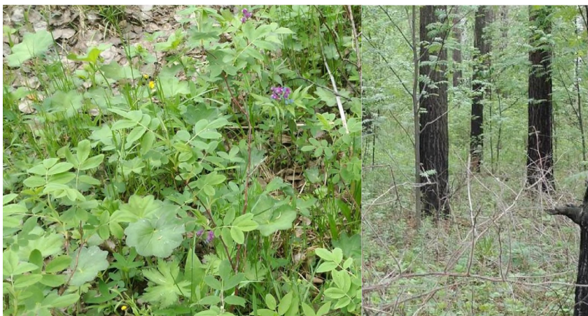
Горельник 4-летней давности, С. ртр., ПП 5С/21 A fire-damaged forest area 4 years ago, mixed-grass pine, SP 5C/21