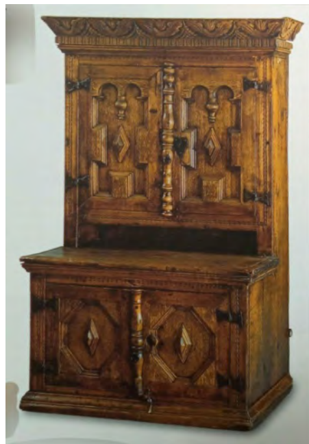
Рис. 2. Русский буфет из древесины сосны начала XVIII в.

Одним из наиболее популярных направлений оформления являются традиционные народные орнаменты и узоры (рис. 3). Искусные руки, богатство творческой фантазии самородков-художников превращали предметы быта, орудия труда, архитектурные детали деревянного зодчества в произведения искусства. Резьба начинает тяготеть к более рельефным, выпуклым формам, меняются приемы ее исполнения [1]. Мастера создавали удивительные узоры, вырезанные вручную, украшая ими поверхности изделий. Элементы резьбы, росписи по дереву или инкрустация служили не только украшением, но и защитой, поскольку многие орнаменты имеют сакральный смысл.