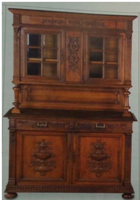
Рис. 1. Французский дубовый буфет конца XIX в.

Однако несмотря на то, что Россия подверглась западному влиянию в изготовлении мебели, в ней оставались свои особенные черты, присущие тому или иному народу. Многогранность культур приносила в каждую вещь что-то свое близкое. Так, буфет из древесины сосны обнаруживает черты, типичные для архитектуры того времени. Накладные точеные элементы выделяют верхнюю и нижнюю секции, проходя по стыку дверей. Крупные кованые петли, на которых закреплены дверцы, служат частью декора [2]. При этом каждый народ оформлял мебель в соответствии со своими традициями (рис. 2).