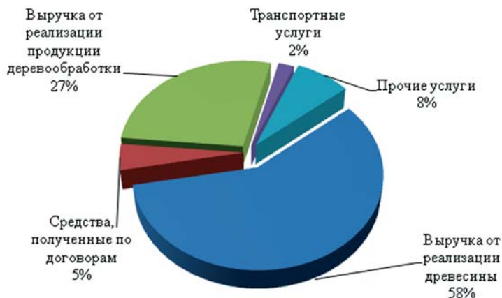
Рис. 2. Структура доходов ГУП СО «ЛХПО» за 2012 г.

Структура доходов по видам продукции и услуг, оказанных предприятием в 2012 г., представлена на рис. 2.