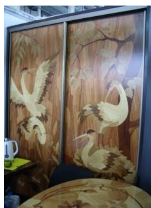
Рис. 10. Двери в шкафу купе выполнены с помощью техники маркетри