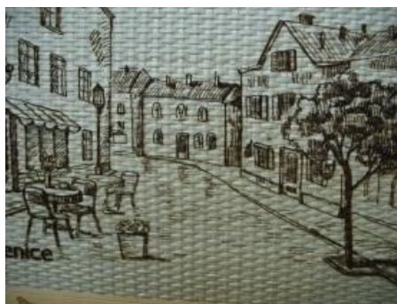
Рис. 11. Лазерная гравировка на ротанге