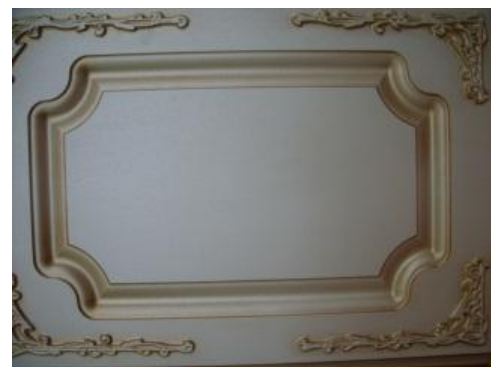
Рис. 4. Фрезерование выполнено на фасаде из МДФ