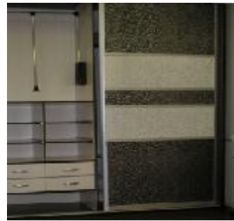
Рис. 6. Двери-купе со вставками из искусственной кожи