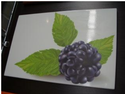
Рис. 5. Полноцветная фотопечать изображена на фасаде из МДФ

10,3 % приходится на такой вид отделки, как искусственная кожа (рис. 6). Мебель, фасадные элементы которой декорированы этим оригинальным материалом, выглядит дорого и солидно, а также вносит в интерьер теплоту. Такие фасады не требуют серьезной обработки и неприхотливы в эксплуатации. 8,24 % занимает шелкография (рис. 7), так называемая трафаретная печать, которая придает мебели уникальность и изысканность. При декорировании методом шелкографии можно использовать различные стилевые направления, чтобы объединить мебель с интерьером помещения. Золочение (рис. 8) применяют в 7,21 % случаев декорирования мебели. Этот способ придает поверхности фасадов очень эффектный внешний вид и эксклюзивность. Позолота украшает мебель, повышает ее ценность и эстетические качества.