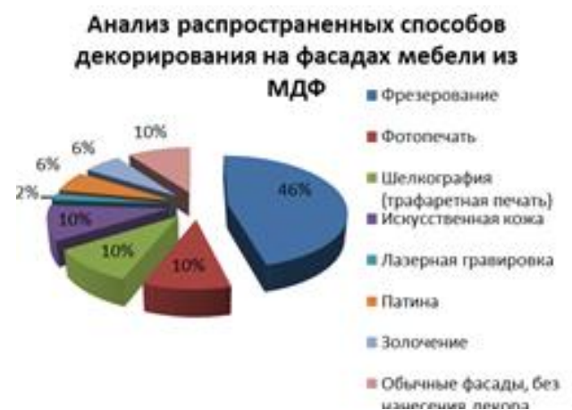
Рис. 2. График анализа способов декорирования на фасадах мебели из МДФ