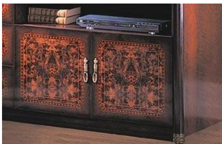
Рис. 7. Шелкография выполнена на фасадах пристенной мебели