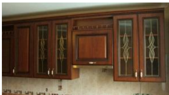
Рис. 9. Патина на кухонном гарнитуре

4,12 % занимает маркетри (рис. 10). Данный способ – для ценителей натурального и красивого. Сложность построения такой мозаики придает этому художественно-декоративному способу утонченность и изысканность. 3,09 % – это лазерная гравировка (рис. 11), которая приходит на смену выжиганию. Это новый способ заинтересовывает покупателей быстротой нанесения и разнообразными трафаретами. Тиснение (рис. 12) применяют в 1,03 % случаев. Его используют для создания рельефного рисунка на поверхности деталей мебели [2]. Тисненный декор придает изделию классический, строгий и в тоже время богатый вид, который ценится уже не одно десятилетие.