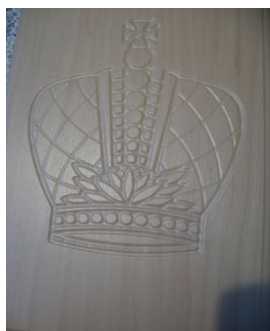
Рис. 1. Рисунок методом фрезерования выполнен на фасаде из МДФ

Ежегодно во многих городах России и даже мира проходят выставки, посвященные мебельной промышленности. Так и в Екатеринбурге проводят различные выставки, которые являются актуальными и полезными. Любой житель города и области может без проблем познакомиться с новинками в мебельном производстве, выбрать более приемлемый вариант для себя и приобрести нужную продукцию.