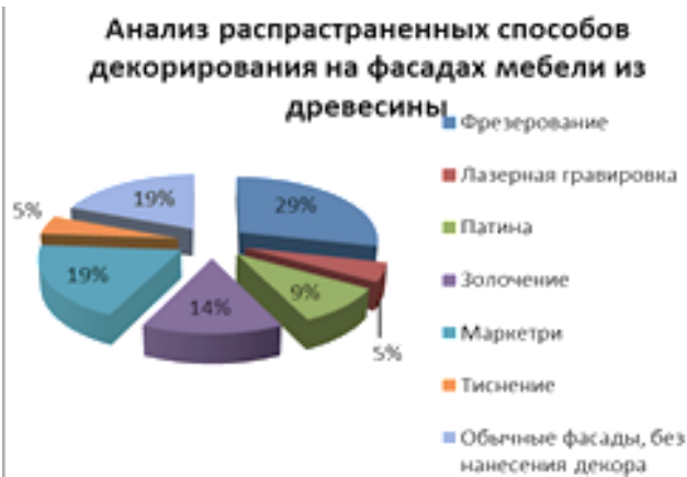
Рис. 1. График анализа способов декорирования на фасадах мебели из древесины

Фрезерование (рис. 4) – самый популярный способ художественно-декоративной отделки. 33,05 % использования этого способа приходится на долю магазинов, которые работают с древесиной, МДФ и ЛДСП.