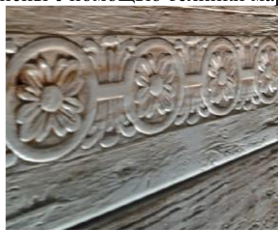
Рис. 12. Тиснение на древесине

Мебельная промышленность развивается довольно быстро. Древесину всегда использовали в данном производстве, и на сегодняшний день она остается незаменимым материалом. Однако спрос на мебель из древесины сейчас гораздо ниже, чем 40-50 лет назад. Древесину стали все больше использовать как основной компонент в композиционных древесных материалах, которые занимают первое место на мебельном рынке благодаря своей простоте в обработке и многообразию способов их декорирования. Древесные материалы с различным декором на поверхности придают изделию красоту, которая нужна потребителю за небольшую стоимость.