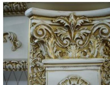
Рис. 8. Золочение как способ создания декора