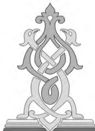
Рис. 4. Пример животного орнамента