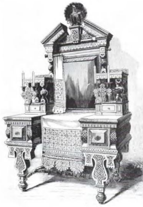
Рис. 2. Туалетный столик в псевдорусском стиле, 1870 г.

На смену традиционному русскому стилю постепенно пришел псевдорусский . Художники и мастера в поисках нового оригинального направления создали некое сочетание старых бытующих форм, исконно русских народных мотивов и современных конструктивных решений. Изделием, на примере которого можно проследить основные тенденции псевдорусского стиля, является туалетный столик, созданный по эскизам профессора Монигетти, работы краснодеревщиков Бюхтгера и Штанге (рис. 2).