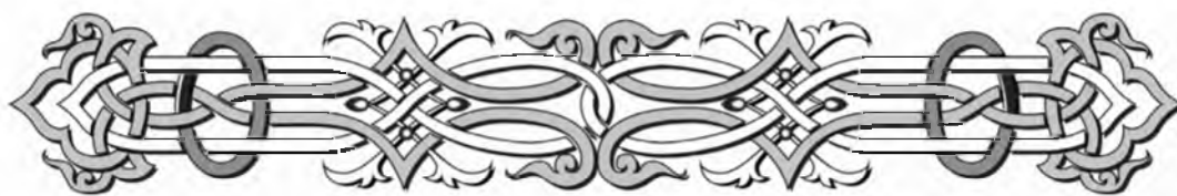
Рис. 5. Пример ленточного орнамента

Изучая особенности русского стиля, можно с большой уверенностью определить в нем наличие эклектики. Художники и мастера в поисках нового оригинального направления создали сочетание новых форм и традиций. Псевдорусский стиль по праву может называться одним из самых интересных явлений в национальной художественной культуре, что все больше привлекает современных отечественных и зарубежных дизайнеров.