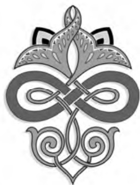
Рис. 3. Пример растительного орнамента

Русский орнамент поражает своей оригинальностью, разнообразием и красотой. Различают основные типы орнамента: геометрический; с использованием флористических элементов (рис. 3); с использованием фигур и образов животных (грифоны, жар-птица) (рис. 4). Наиболее характерные формы для русского орнамента – сплетение лентообразных полос с сужающе-расширяющимся ритмом, расположенных под разными углами, с изгибами и причудливыми переплетениями (рис. 5) [2].