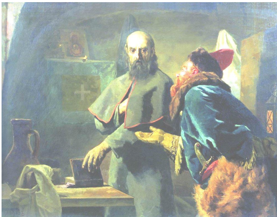
Н.В. Неврев. Митрополит Филипп и Малюта Скуратов. 1898.

Малюта – от малый . Комплексовал из-за своей плюгавости. Вымещал сознание собственного ничтожества в невероятной жестокости. Задушил митрополита Филиппа. Иван Грозный называл филькиными грамотами обличительные послания убиенного. Протестные обращения нынешних правозащитников имеют в глазах адресатов такое же значение?