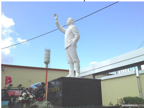
Шелангер. 2015 г.