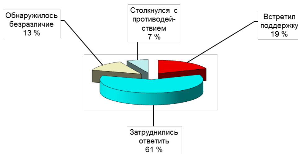
Рис. 2. Если Вы участвовали в создании и/или внедрении нового, то встретили ли Вы поддержку или противодействие?

Причиной низкого уровня активности вовсе не является отсутствие поддержки или противодействие новаторам. Результаты опроса показывают, что пятая часть работников встретили поддержку своим предложениям (18,9 % от числа опрошенных), в то время как лишь 6,8 % работников столкнулись с противодействием (рис. 2). При этом 13,4 % опрошенных заявили, что столкнулись с безразличием к своим предложениям.