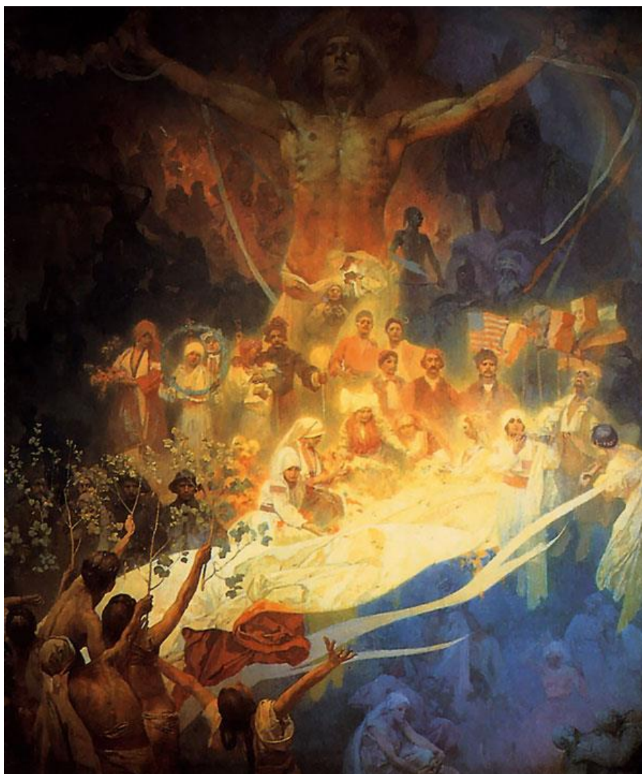
Худ. Альфонс Муха. Апофеоз истории славянства. 1926 г.

Опубликовано в электронном журнале «Переформат» 12 июля 2016г. ( http://pereformat.ru/klyosov/ ). Печатается с разрешения автора ( http://pereformat.ru/2016/07/nedруги/ ).