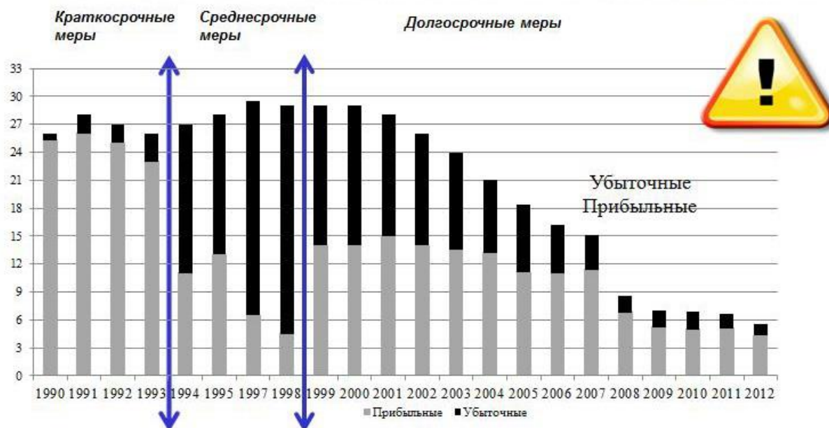
Рис. 1. Динамика рентабельных и убыточных сельхозпредприятий России.

Приравставшая до 1990-х ежегодно на 1 млн. чел., РФ стала вымирать с темпами выше 1 млн. чел. Официальная статистика подтверждает: в РФ по программам США, ЕС с 1990-х действительно осуществляется методичная, поэтапная ликвидация колхозов, совхозов, как основы жизни и деятельности сельского населения, производителей 80% продовольствия для городов и промышленных центров страны. И соответственно массовая ликвидация титульного населения.