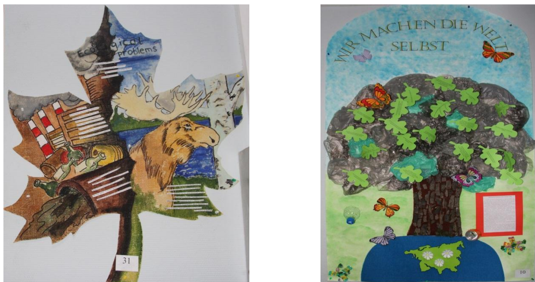
Рис. 1. Стенгазеты «Экология Урала»

Обычно авторские коллективы не только стремятся привлечь внимание читателей к содержанию, донести до них необходимую информацию, но и пробудить у них интерес к самой газете. Это достигается яркостью оформления, необычностью изобразительных форм, их новизной. Поэтому некоторые стенгазеты, в которых присутствуют элементы мозаики, аппликации, вышивки, можно по праву назвать предметом прикладного творчества (рис.1).