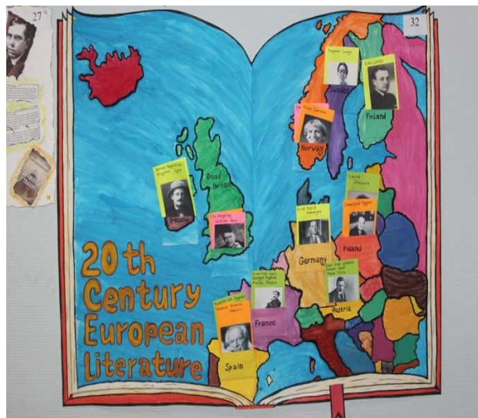
Рис. 3. Стенгазеты «Литературная карта мира»

В этой связи выпуск стенной газеты следует рассматривать как творческий проект с его главной составляющей – исследовательской самостоятельной работой обучающихся под руководством преподавателя.