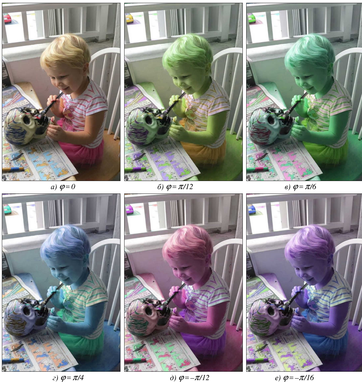
Рис. 1. Изменение цветового тона у исходного изображения \mathbf{f}(\mathbf{z}) \rightarrow \mathcal{A} \cdot \mathbf{f}(\mathbf{z}) = (1, e^{i\varphi}) \cdot (f_{lu}(\mathbf{z}), \mathbf{f}_{ch}(\mathbf{z})) = (f_{lu}(\mathbf{z}), e^{i\varphi}\mathbf{f}_{ch}(\mathbf{z})) : исходное изображение “Yorick” ( \varphi = 0 ) (а), \varphi = \pi/12 (б), \varphi = \pi/6 (в), \varphi = \pi/4 (г), \varphi = -\pi/12 (д), \varphi = -\pi/6 (е)

меняют яркость, цветовой тон и насыщенность цветного изображения. Множество таких преобразований формирует яркостно-хроматическую группу