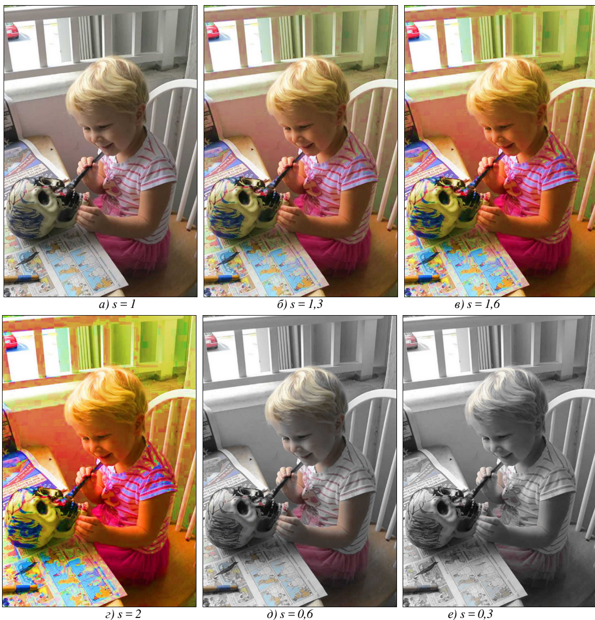
Рис. 2. Изменение насыщенности исходного цветного изображения \mathbf{f}(\mathbf{z}) \rightarrow \mathcal{A} \cdot \mathbf{f}(\mathbf{z}) = (1, s) \cdot (f_{lu}(\mathbf{z}), \mathbf{f}_{ch}(\mathbf{z})) = (f_{lu}(\mathbf{z}), s \mathbf{f}_{ch}(\mathbf{z})) : исходное изображение "Yorick" ( s = 1 ) (а); s = 1,3 (б); s = 1,6 (в); s = 2 (г); s = 0,6 (д); s = 0,3 (е)

Если же \mathcal{A} = (1, Z_{ch}) = (1, se^{i\varphi}) , то преобразования