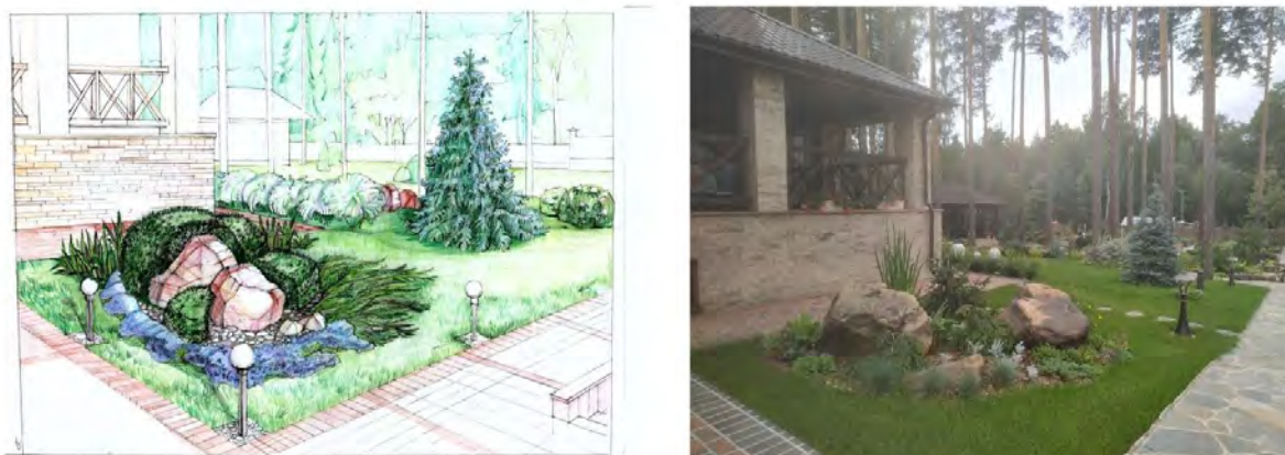
Рис. 1. Проект и воплощение входной группы с камнями

На рис. 1 представлен эскиз группы с камнями, расположенный справа от входа в дом, и воплощение этого эскиза в реальности.