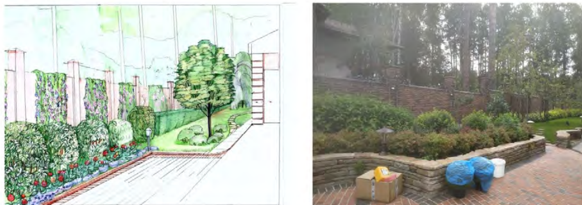
Рис. 2. Проект и воплощение входной группы с подпорной стенкой

На рис. 3 приведен предполагаемый ассортимент для посадки вдоль зоны ручья и указано их количество. В данный список входят такие растения, как ель, ирис, можжевельник, спирея, бруннера, осока, хоста и вероника.