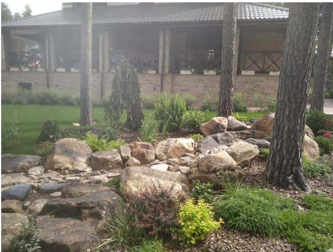
Рис. 4. Реализация зоны с ручьем

Таким образом, можно сделать вывод о том, что в данном случае проектные решения, которые были предложены для озеленения участка, были реализованы частично. Можно предположить, что это могло быть связано как с возникновением проблем при непосредственной посадке определенных видов растений, так и с последующими пожеланиями самих заказчиков. Однако в целом общая концепция выдержана, прослеживается сохранение главных композиционных решений.