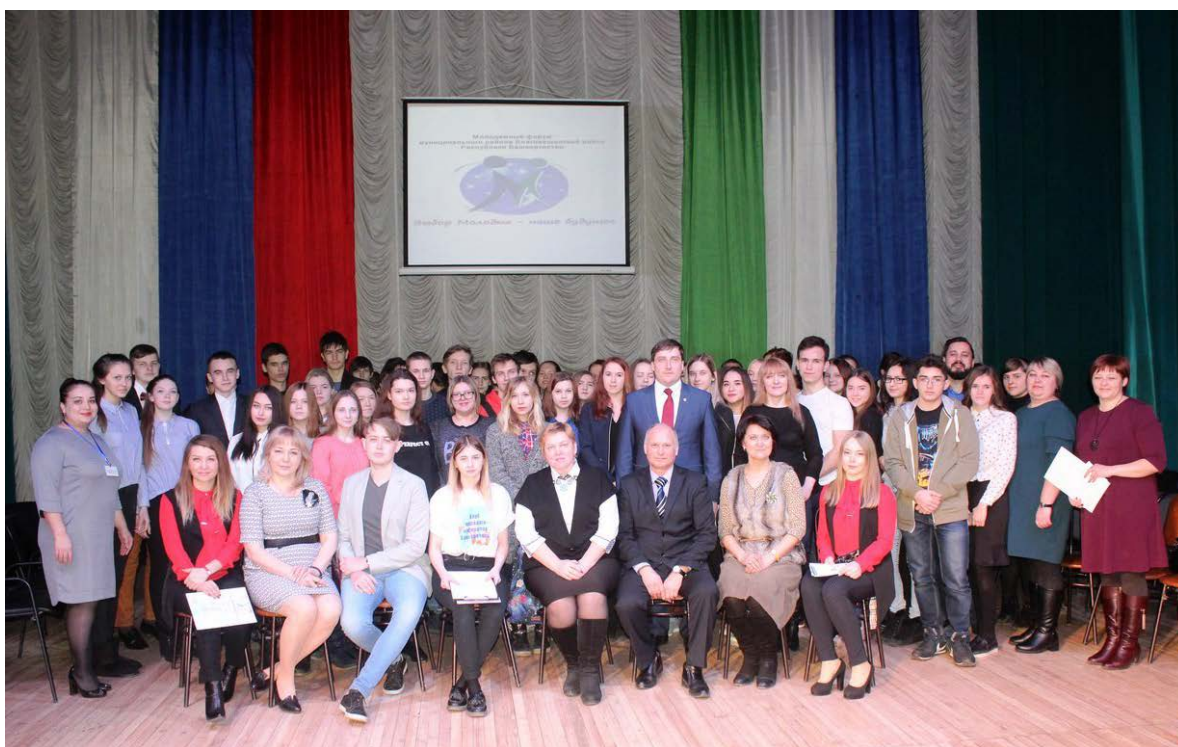
Рис. 3. Участники молодёжного форума «Выбор молодых – наше будущее»

Молодежный форум – это место, которое объединяет яркую, активную и талантливую молодежь. Так, 6 февраля 2018 г. Клуб молодого избирателя организовал в г. Благовещенске Республики Башкортостан молодёжный форум «Выбор молодых – наше будущее» (рис. 3).