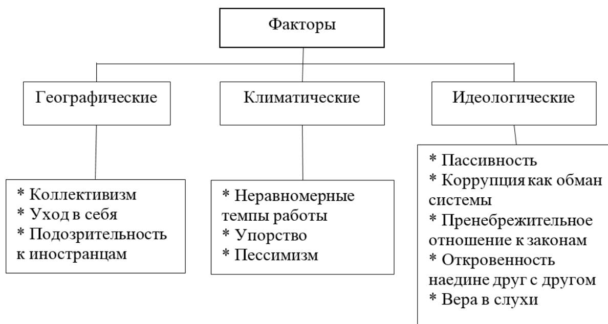
Рис. 1. Факторы, повлиявшие на формирование менталитета

Ознакомление с факторами, повлиявшими на формирование многогранного национального характера, необходимо для более точного определения российского менталитета. Многие исследователи полагают, что основные черты российской культуры и менталитета народа связаны с природными факторами. Так, Р. Льюис считает, что основными факторами формирования менталитета русского народа являются суровый климат и огромные пространства (рис. 1) [2].