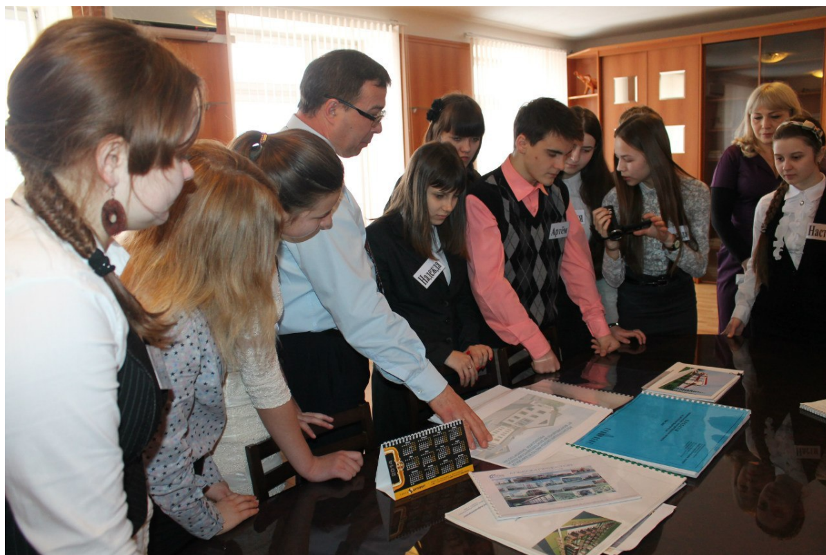
Рис. 1. Члены Клуба молодого избирателя в гостях у главы администрации

Следующее заседание Клуба молодого избирателя состоялось 19 марта 2014 г., на котором участников клуба познакомили с деятельностью главы и сотрудниками Администрации муниципального Благовещенского района Республики Башкортостан (рис. 1).