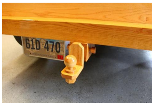
Рис. 14. Фаркоп автомобиля Ford Pickup Truck

Деревянный шаровой фаркоп – самый уникальный и эстетический элемент автомобиля, способный выдержать не очень большую нагрузку (рис. 14).