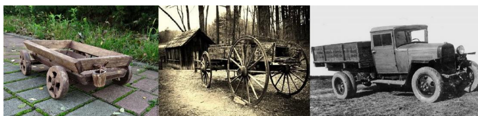
Рис. 2. Первая деревянная техника

Используя физико-механические характеристики древесины (прочность, износостойкость, теплопроводность, привлекательный внешний вид и т. д.), её используют для возведения инженерных сооружений различной сложности, а также для изделий различного назначения (мебели, бытовой утвари, игрушек и т. д.). Использовали этот природный материал с давних времен – это и первые деревянные колеса, и телеги, а с появлением первых грузовых автомобилей дерево прочно вошло в автомобилестроение в качестве основного материала при конструировании кузова (рис. 2).