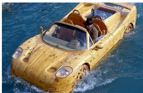
Рис. 18. Автомобиль-амфибия Ferrari F50

В настоящее время древесина считается ценным материалом для отделки и дизайна интерьеров салонов различных автомобилей, относящихся к классу люкс [3]. И, возможно, в сфере автомобилестроения произойдет возврат к прошлому, и на дорогах современных мегаполисов снова появятся автомобили, сделанные из древесины, и они будут считаться самыми крутыми и стильными.