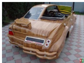
Рис. 1. Автомобиль из дерева «Химера»; дизайнер В. Лазаренко

Дерево и автомобиль – на первый взгляд может показаться, что это два абсолютно не совместимых понятия. Бытует мнение, что древесине нет места в автомобилестроении, так как она хорошо горит. Но авто-дизайнеры совершенно другого мнения и любят применять дерево для интерьерной отделки салонов автомобилей премиум класса, используя различные вставки из ценных или экзотических пород древесины. За счет отделки салона любое транспортное средство можно сделать современным, оригинальным и креативным. Как ни странно, древесина отлично подходит не только для декорирования интерьеров и строительства домов, но и вполне возможно ее использовать для создания настоящих машин, получая элитные деревянные автомобили (рис. 1).