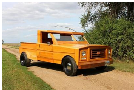
Рис. 9 – Деревянный Ford Pickup Truck

Житель одного небольшого городка Южной Дакоты автодизайнер Al Schoffulman изготовил деревянный Ford Pickup Truck из красного дуба (рис. 9).