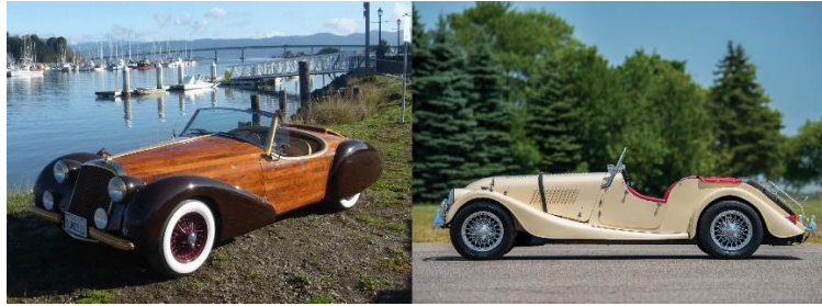
Рис. 5. Автомобиль из дерева «Морган» (Англия)

Изготовление деревянных каркасов очень трудоемкое дело. Мастера-кароцери создают настоящие автомобильные шедевры. Прекрасные формы могут сделать только настоящие художники и профессионалы своего дела. Каждый брусок каркаса имеет криволинейную форму, которую можно достичь только путем предварительного распаривания и размачивания древесины и последующего сгибания ее в нужную заготовку. При выборе заготовок следует обращать внимание на естественный изгиб волокон, а во время работы – стараться сохранять их направление. Дерево, как и любое природное сырье, может деформироваться, начать гнить и разлагаться. Этому способствуют неблагоприятные, порой даже агрессивные факторы внешней среды, воздействие разного рода бактерий, плесени и насекомых вредителей. Для избавления от таких проблем необходимо заранее позаботиться о древесине и обработать ее эффективным антисептическим средством.