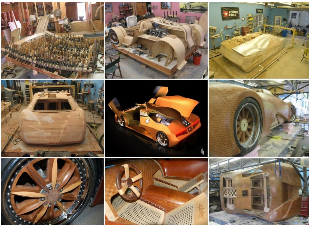
Рис. 8. Этапы работы по созданию суперкара Splinter

Данный двухместный суперкар намного легче современных суперкаров: его масса составляет 1 134 кг, автомобиль способен развивать скорость более 300 км/ч. На сегодняшний день данный суперкар существует в единственном экземпляре, так как главной целью разработчиков было – показать и доказать, что автомобиль возможно сделать из универсального природного материала – дерева, обладающего уникальными физико-механическими свойствами (рис. 8).