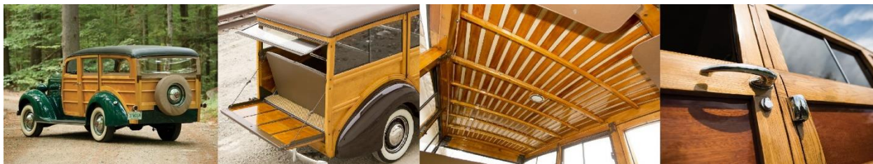
Рис. 3. Деревянные американские «Универсалы»

постепенно вытеснять деревянные конструкции, и лишь к 1950 г. после осознания непрактичности деревянных конструкций пришлось частично отказаться от дерева, как от дорогостоящего материала в обслуживании и ремонте. Полностью отказаться от использования древесины в изготовлении авто не смогли и перешли к выпуску автомобилей с внешними деревянными панелями и к автомобилям, замаскированным под деревянные (рис. 3).