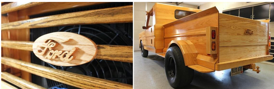
Рис. 15. Деревянная эмблема Форда на автомобиле Ford Pickup Truck

Пол кузова полностью соответствует стилю американского пикапостроения (рис. 16).