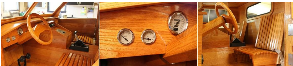
Рис. 12. Интерьер салона автомобиля Ford Pickup Truck

Большинство элементов изготовлены из древесины твердых пород, за исключением кузова, пола кабины и пожарной перегородки, выполненных из фанеры. Кресла автомобиля имеют специфическую форму и больше напоминают деревянные скамейки. Большие трудности при конструировании авто возникли с проектированием и изготовлением рулевой колонки и деревянного руля, облицованного красным дубом. Двери, изготовленные из дерева, крепятся обычным традиционным способом с использованием петель (рис. 13).