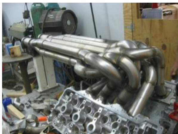
Рис. 7. Двигатель Cadillac V8 суперкара Splinter

механической коробкой передач (от Chevrolet Corvette C5) и дифференциалом повышенного трения Getrag. Во избежание риска самовозгорания автомобиля была изменена конфигурация выхлопных труб (рис. 7).