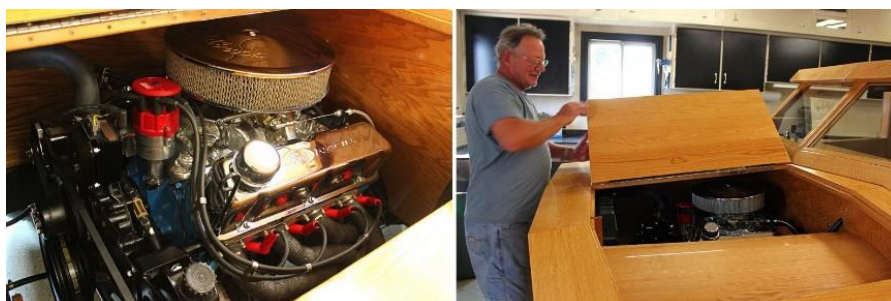
Рис. 11. Двигатель Ford Pickup Truck

Мастеру пришлось сместить вперед двигатель, передвинуть ближе к осевой линии коробку передач, укоротить раму для сохранения пропорций авто. Установить новые головки цилиндров и вычистить до блеска 150 000-мильный двигатель (рис. 11).