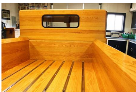
Рис. 16. Деревянный кузов автомобиля Ford Pickup Truck

Пол кузова полностью соответствует стилю американского пикапостроения (рис. 16).