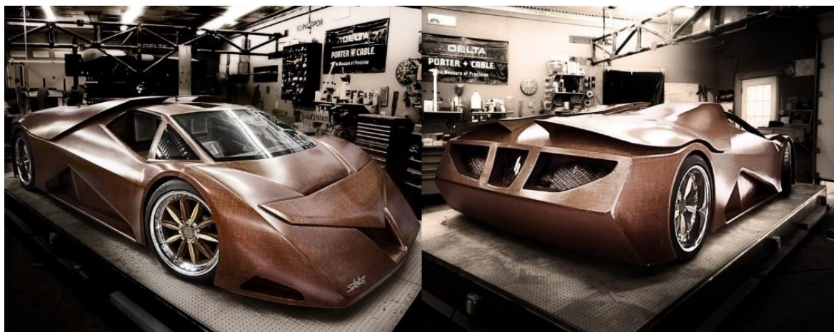
Рис. 6. Суперкар Splinter

Обучающиеся Государственного университета Северной Каролины (North Carolina State University) считают дерево лучшим материалом для создания автомобилей [2]. Разработанный проект деревянного суперкара Splinter – доказательство того, что дерево – лучший материал для создания автомобилей. Созданный суперкар намного мощнее и быстрее существующих суперкаров Lamborghini и Porsche. Древесина использовалась в разных частях автомобиля – в кузове, подвеске и даже центральной части колесных дисков. Предпочтение было отдано нескольким сортам древесины: маклюре оранжевой (самой прочной древесине Северной Америки), дубу, ореху и вишне. Из маклюры сделана подвеска, дубовый шпон пошел на колеса, из ореха – передняя часть кузова, а из вишни – задняя его часть (рис. 6).