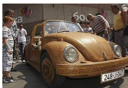
Рис. 17. Дубовый чешуйчатый Volkswagen Beetle

Al Schoffulman – истинный творец и большой любитель автомобилей, имеющий много интересных задумок по дальнейшему усовершенствованию своего деревянного любимца – джипа Ford Pickup Truck. Многие настоящие умельцы и мастера больше любят и ценят сам процесс работы чем ее результат. Босниец Момир Божич (Mimir Bozhich) создал свою версию Volkswagen Beetle – дубовый чешуйчатый «Жук» с максимальным использованием деталей из дерева, который является полной копией оригинального автомобиля (масштаб 1:1) (рис. 17).