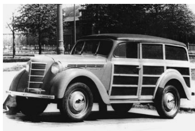
Рис. 4. «Москвич-400-422» «Буратино», производитель СССР

В 1948 году московские конструкторы СССР, чтобы сэкономить стальной прокат, выпускают небольшой серией фургончик с деревянным кузовом «Москвич-400-422» «Буратино» грузоподъемностью 200 кг (рис. 4).